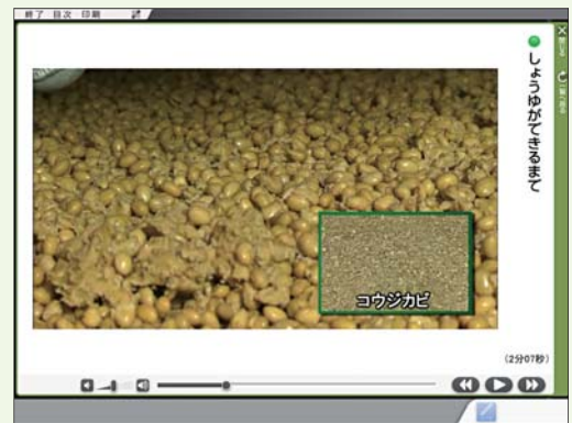
動画「しょうゆができるまで」

教材に即した動画、ワークシート、アニメーションなどを収録しています。「国語デジタル教科書」でしか見ることのできない貴重な資料が満載です。