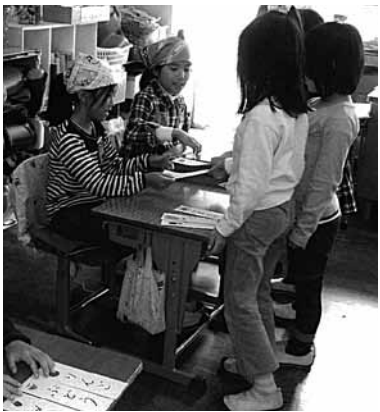
楽しく「おみせやさんごっこ」に取り組む子どもたち。