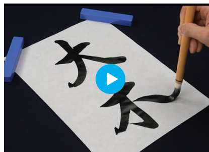
動画「『大木』の筆使い」