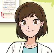
Teacher's Book 朱書 (日本語版)