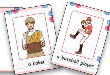
▲トランプサイズ巻末カード