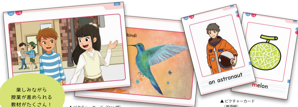
▲ピクチャーカード (Story編)

教科書の巻末カードを、耐久性のあるトランプ大カードにしました。班の数の分を教室に常備していただくと、すぐに活動が始められます。教科書の巻末カードよりも使いやすいサイズで、切る手間もかかりません。