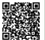
◀ 指導者用デジタル教科書 (教材)